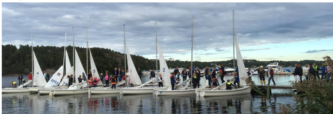
Ett år präglat av många jollar på sjön, kul.

Vid årets slut hade föreningen 237 registrerade medlemmar. Av dessa hade vi 40 som var familjemedlemmar, 15 familjer.